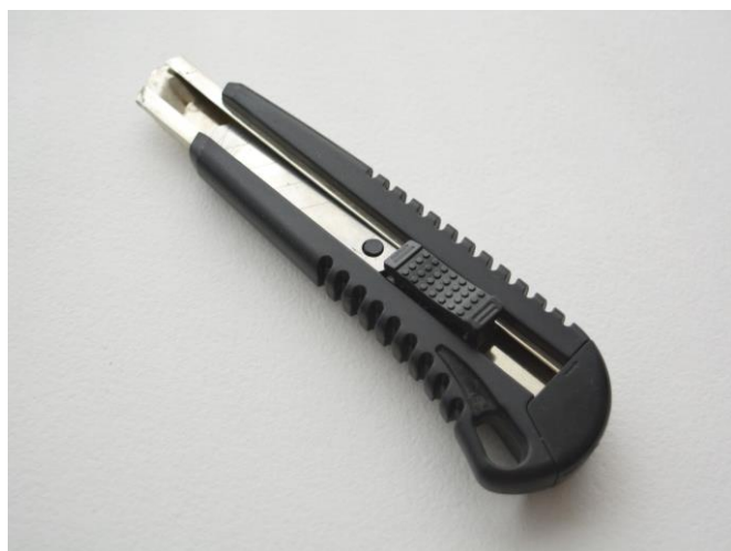
Нож с сегментированными лезвиями