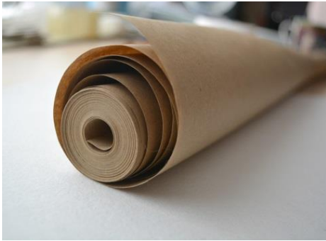
крафт-бумага в рулоне

крафт-пакеты из Ашана, Икеи и т.д. Малярный скотч продают в строймагазинах, хозтоварах. Чековую ленту можно найти в канцтоварах.