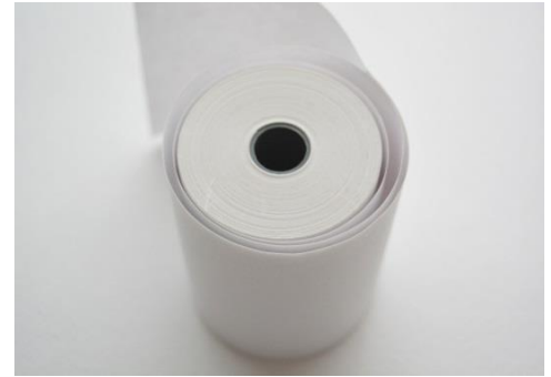
бумажная чековая лента